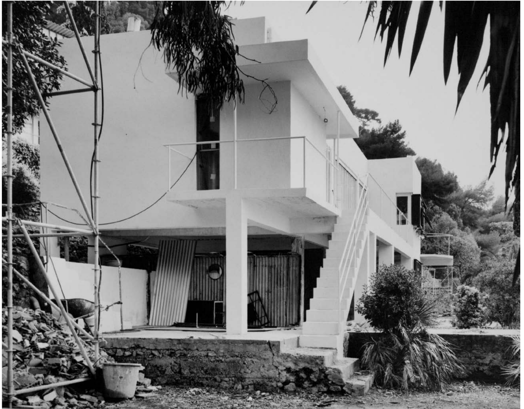
Welcome (TO THE TEKNIVAL) , 2009. E.1027 Maison en Bord de Mer under restaureringen

Abstracta er en helt anden historie, som opstod ved et tilfælde. Jeg deltog i 2006 i et researchprojekt, som bestod i en rejse, der fulgte Titos motorvejsprojekt, The Highway of Brotherhood and Unity , som blev bygget igennem 1940'erne og 1950'erne for at forbinde de nye hovedstæder i det tidligere Jugoslavien. Undervejs på rejsen begyndte jeg at lægge mærke til et bestemt udstillingssystem, som blev brugt næsten overalt i de butikker og de stadig statsejede stormagasiner