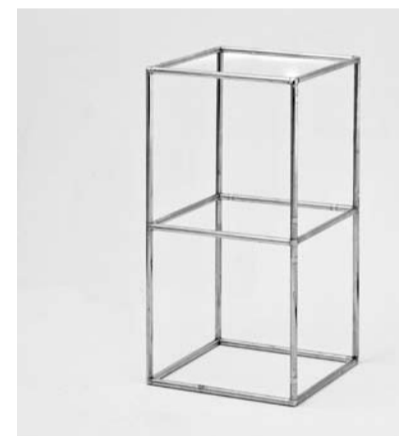
Abstracta , 2010. Udvalg af billeder fra researchmateriale